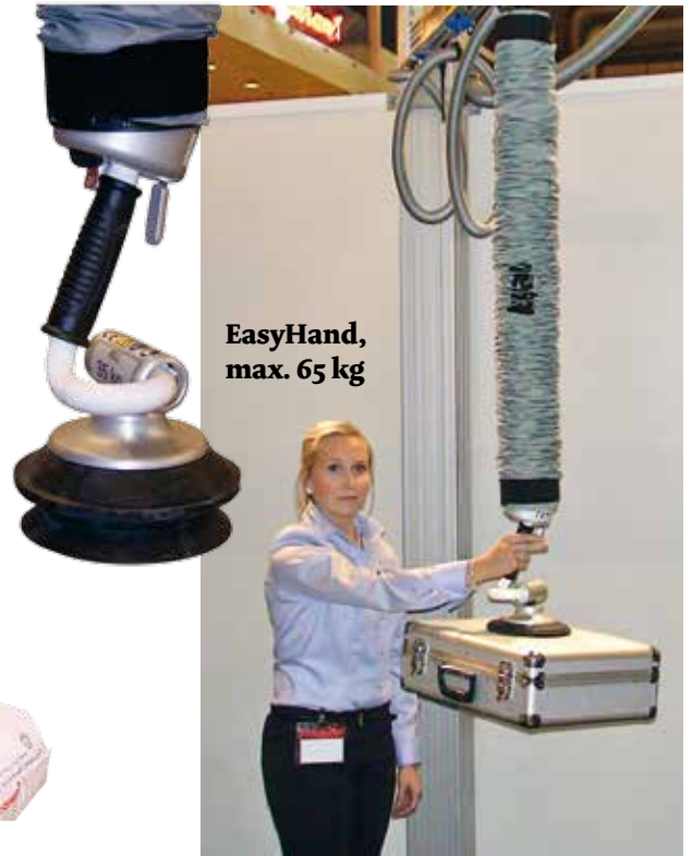
EasyHand, max. 65 kg

EasyHandia on nopea käyttää ja lisäksi nostin on suunniteltu erittäin käteväksi ja ergonomiseksi. Parhaimmillaan EasyHand on kevyiden pakettien ja kappaleiden nopeassa käsittelyssä. EasyHandillä voit nostaa laatikoita, purkkeja, säkkejä, kutistepakkauksia. Pyöreitä kappaleita, kuten rullia ja purkkeja, televisioita, lasikappaleita, lähes mitä tahansa, ja lähes minkä muotoisena tahansa.