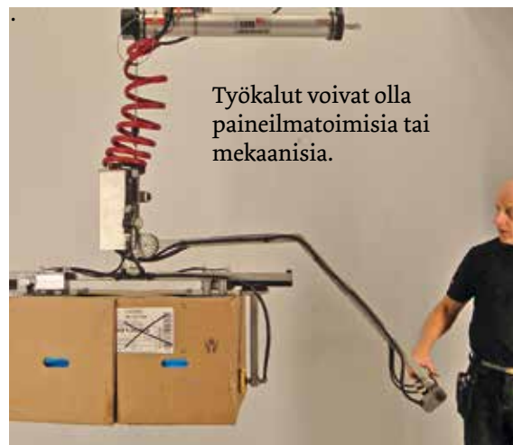
Työkalut voivat olla paineilmatoimisia tai mekaanisia.

Bal-Trol sopii mitä moninaisimpiin käyttökohteisiin max. 1 000 kg:n taakoille . Laite on EX-suojattu, hiljainen ja matalarakenteinen.